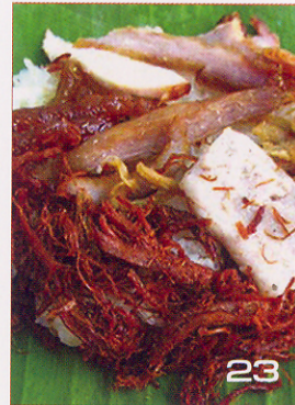
23 มุมชีวิต