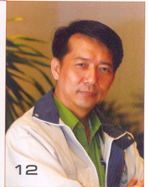
รายงานพิเศษ 12