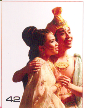
รอบรู้โรเรียนแพทย์ 42