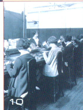
มอนิโบลิงค็อกว้าง