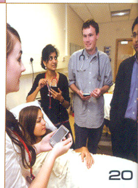
Why Medical Education