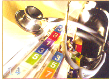
เส้นทางสู่ HA