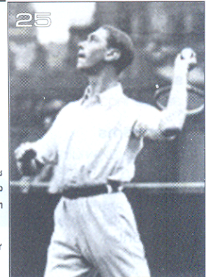
มอไปโนโลกกว่าง