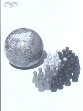
เส้นทางสู่ HA