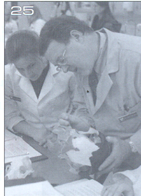
Why Medical Education