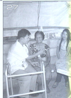
เวทีวิจัย