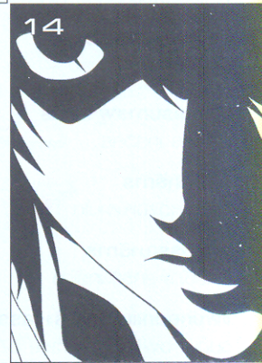
มุมชีวิต