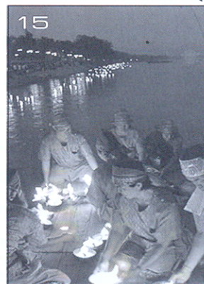
มุมชีวิต