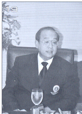
สัมภาษณ์พิเศษ