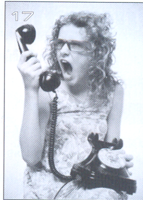
มุมชีวิต