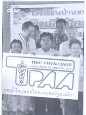
สัมภาษณ์พิเศษ