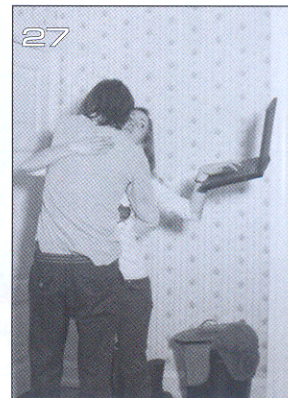
มอนิโบล็อกกิ้ง