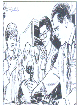
เส้นทาบสู่ HA