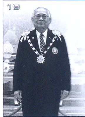
สัมภาษณ์พิเศษ