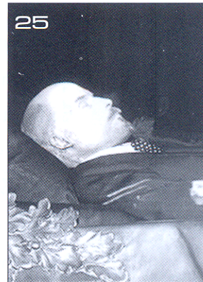
รางวัลประสาธน์ 2488