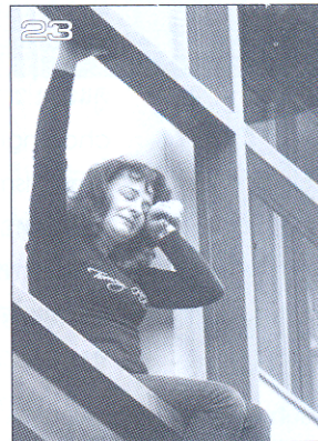
มองไปในโลกกว้าง