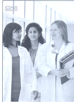
Why, medical Education