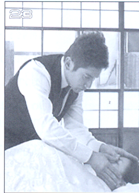
ราชประสงค์ 2488