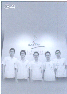
รอบรู้โรเรียนแพทย์