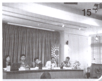
ราชประสงค์ 2488