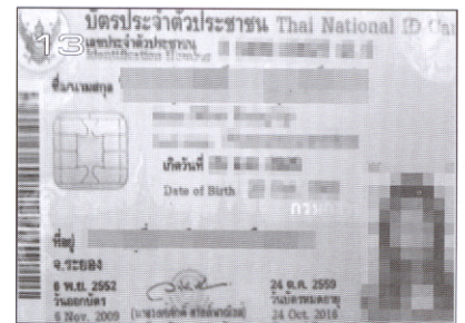
ราชประสมค์ 2488