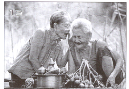
News in Medicine