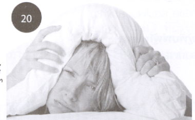
รู้ทันโลก