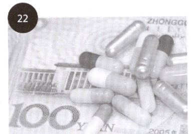
รายงานพิเศษ