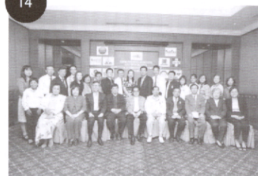
รางประสมค์ 2488