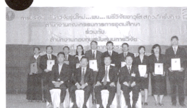
รายงานพิเศษ