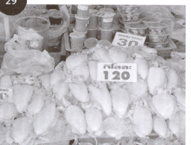
News in Medicine