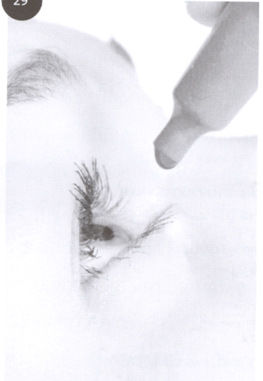
หนึ่งโรค หนึ่งรู้