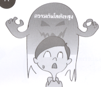
บทความพิเศษ