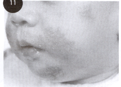
บทความพิเศษ