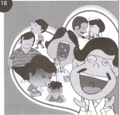
หนึ่งโรค หนึ่งรู้