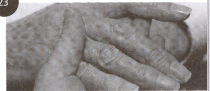
รู้ทันโรค