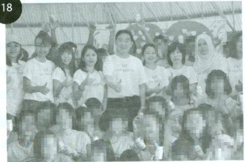
รายงานพิเศษ