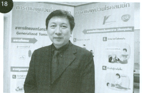
สัมภาษณ์พิเศษ