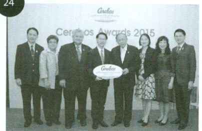
รายงานพิเศษ