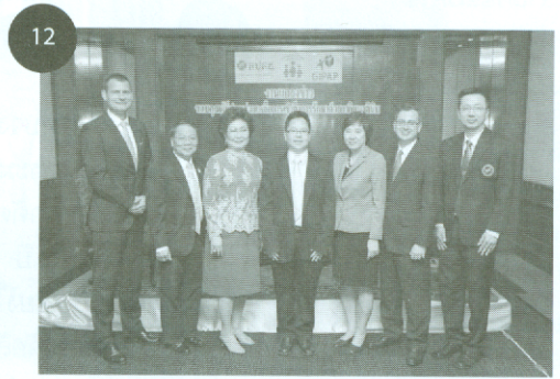
รายงานพิเศษ