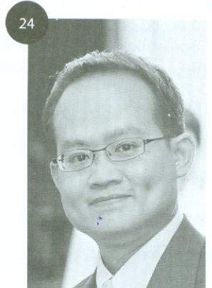
เวทีวิจัย