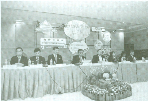
รายงานพิเศษ