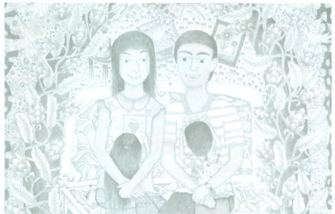
ปกัณกะสูขรภาพ