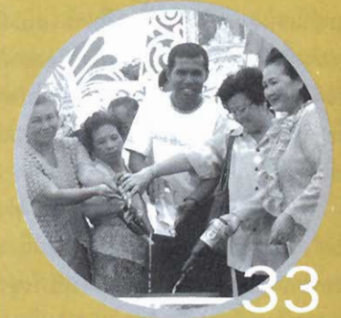
งตเหล่าเข้าพรรษากับเครือข่ายหมออนามัย