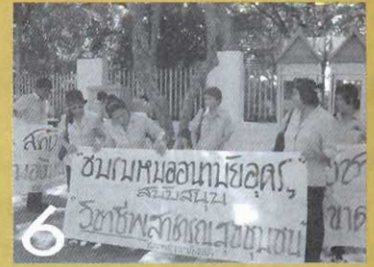
บนเส้นทาง พ.ร.บ. หมออนามัย