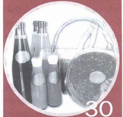
อิม “สุข” จากไร้ เพราะ “แรงใจ” และ “ทำจริง”