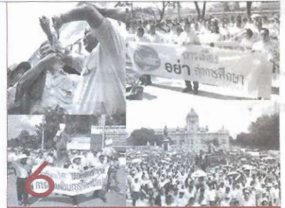
การกระจายอำนาจกับทางเลือกของหมออนามัย