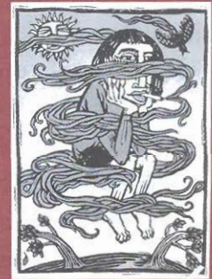
สมนึกกับสำนึก